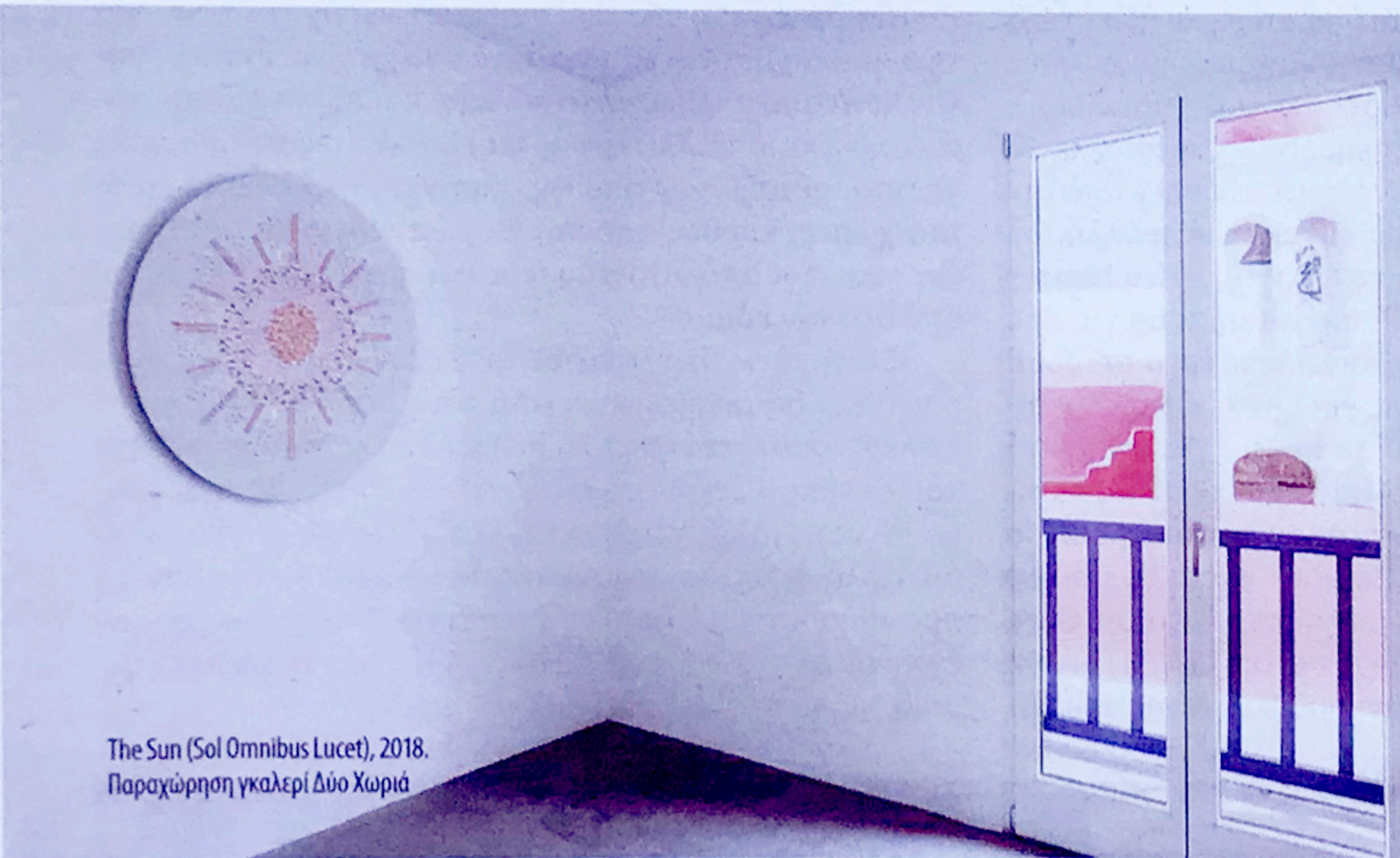
The Sun (Sol Omnibus Lucet), 2018. Παραχώρηση γκαλερί Δύο Χωριά

Μακάρι να μπορούσα να απαντήσω! Έχω κι εγώ μεγάλη περιέργεια να δω τι θα γίνει.