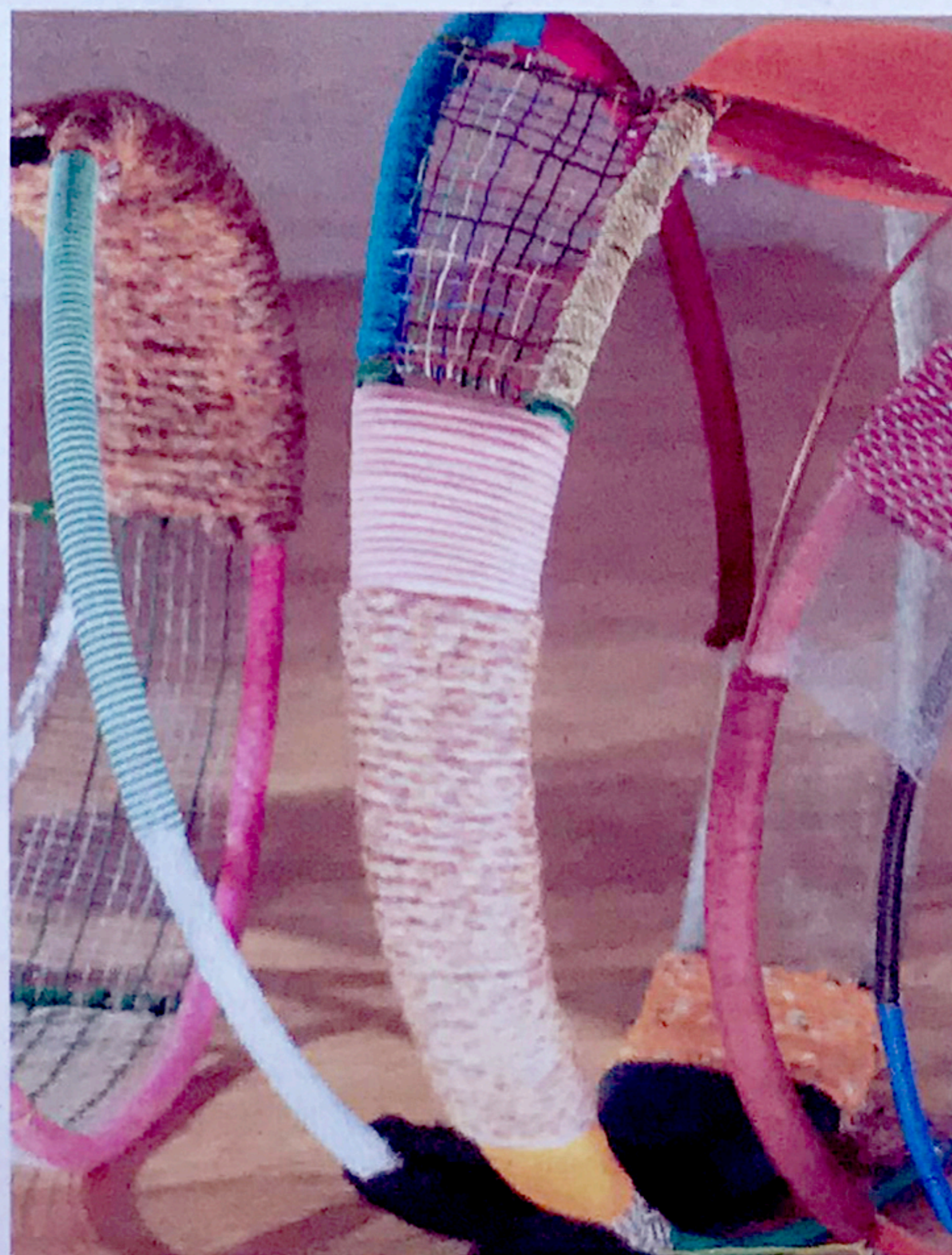
Αίτιλο (λεπτομέρεια εγκατάστασης), 2016.