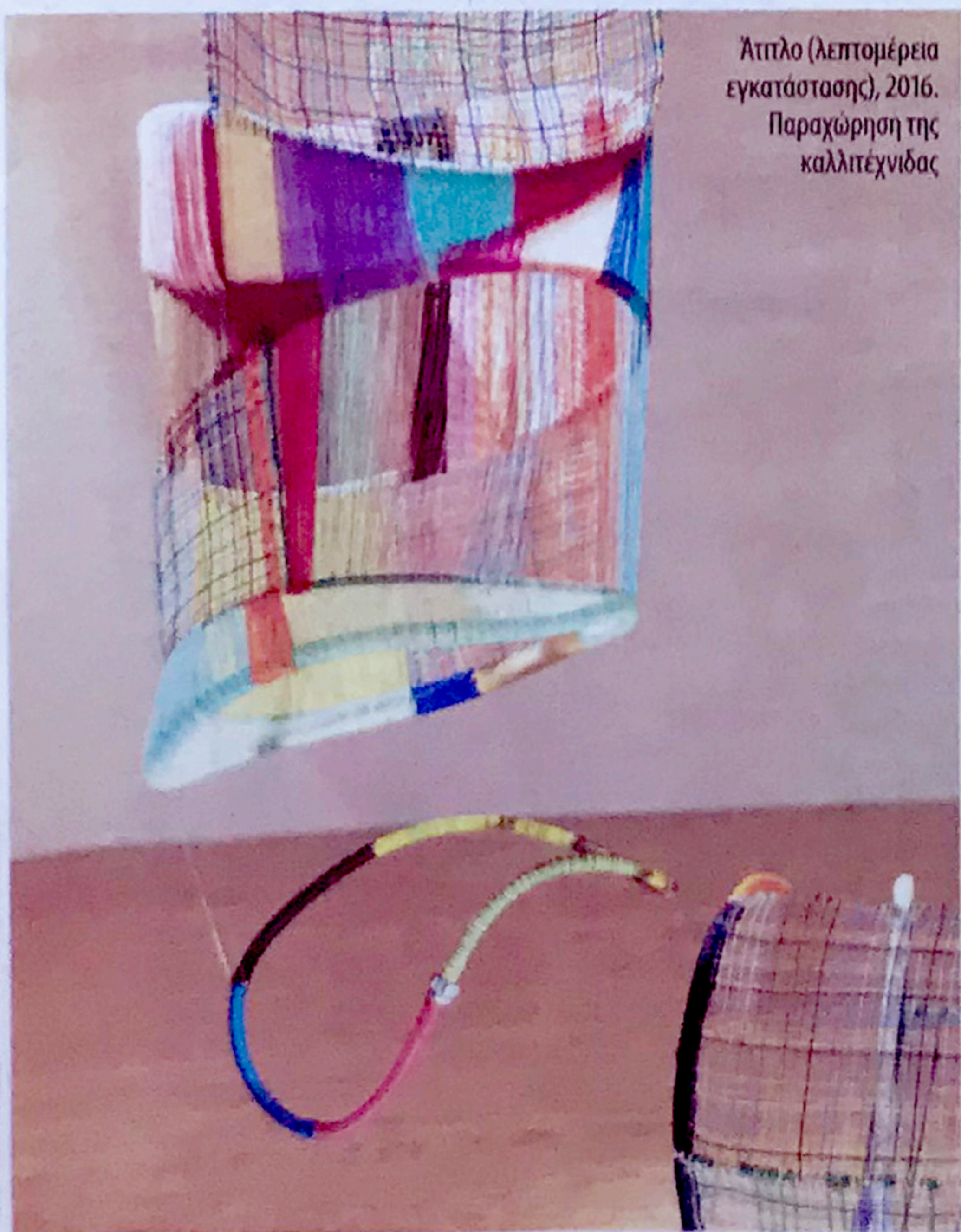
Αίτιλο (λεπτομέρεια εγκατάστασης), 2016.